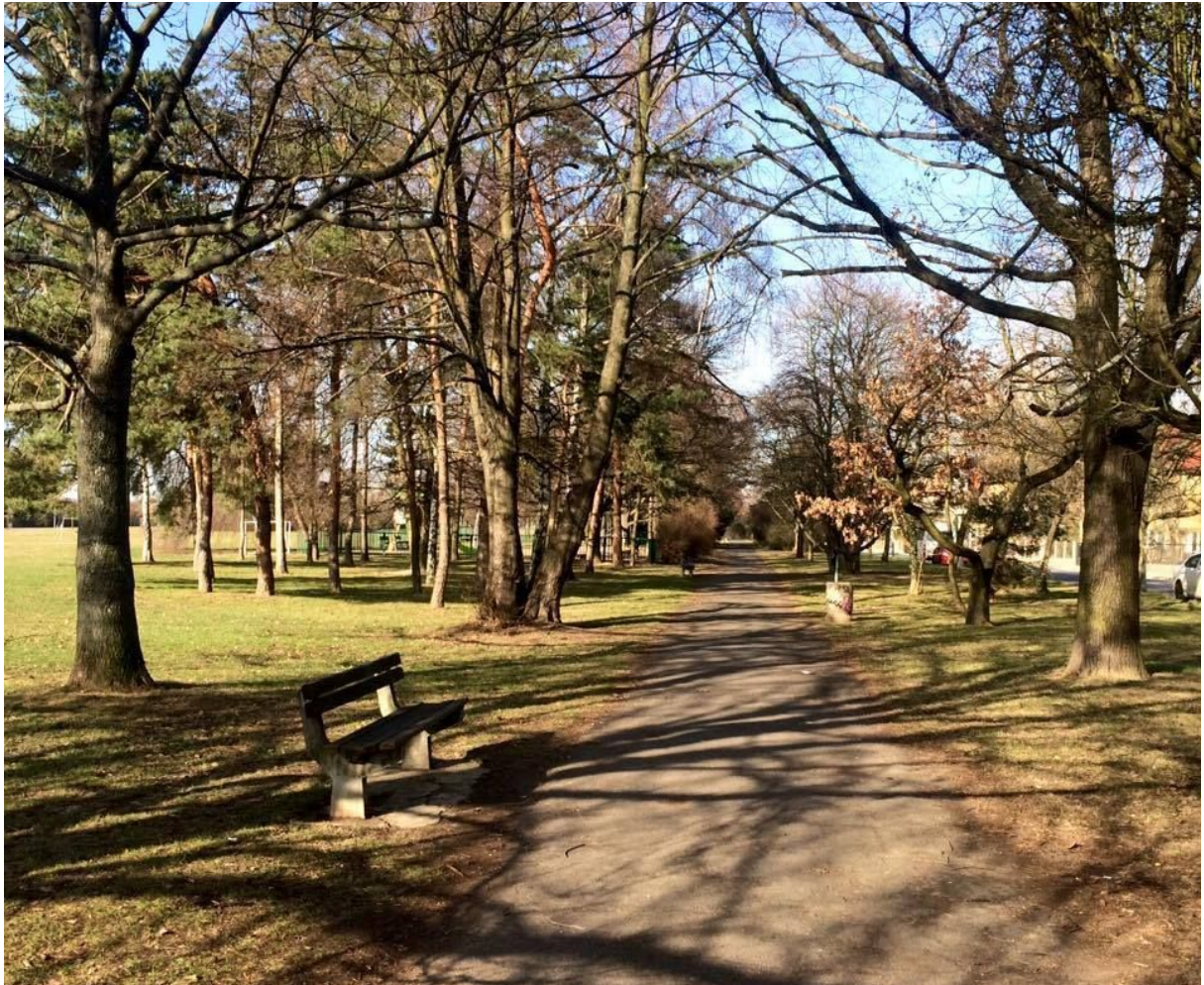
Severní pěší cesta při Tomanově ulici - dosud klidová část parku Ladronka.